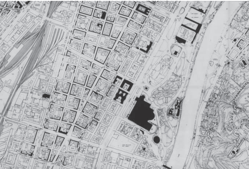
Estratto tavola Edifici di valore storico